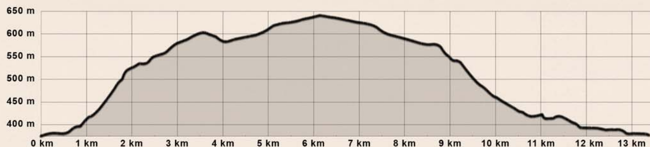
Svartvita spåret - Längd: 13,5 km. Höjdskillnad: 265 m

Vårt längsta spår är också det finaste. Svartvita spåret är en heldagstur eller ett längre träningspass. Spåret följer det Gröna spåret upp till trädgränsen och fortsätter sedan på kalfjället in i Kårsavagge innan det vänder åter.