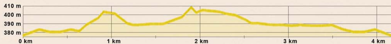
Gula spåret - Längd: 4,5 km. Höjdskillnad: 35 m

Gula spåret är bra som ett uppvärmningsvarv eller som en kort tur i nationalparken. Spåret har inga tunga backar utan går mestadels längs flacka myrar med några lätta utförslopor.