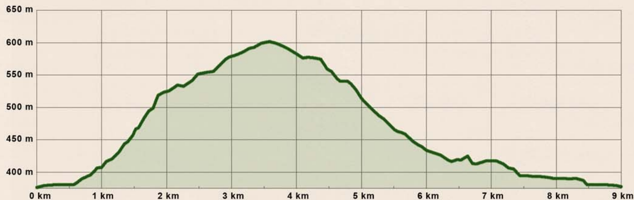
Gröna spåret - Längd: 9 km. Höjdskillnad: 225 m

Gröna spåret är utmärkt som en halvdagstur eller för träning. Gröna har tyngre backar men också storslagna vyer. Oavsett om det är tur eller träning så är det viktigt med bra fäste.